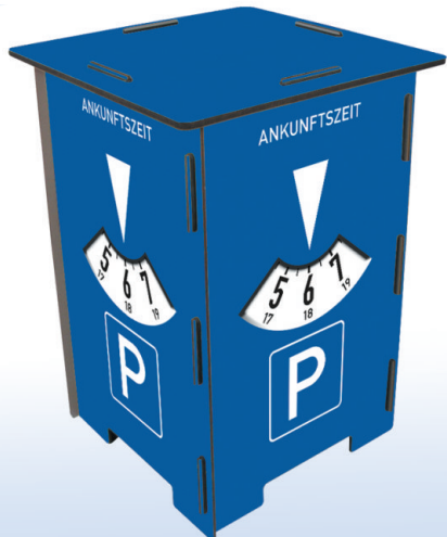
Fotohocker 'Parkuhr', 295 x 295 x 420 mm