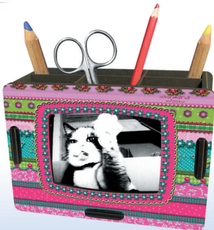
Stiftebox 'Fernseher', 150 x 65 x 105 mm