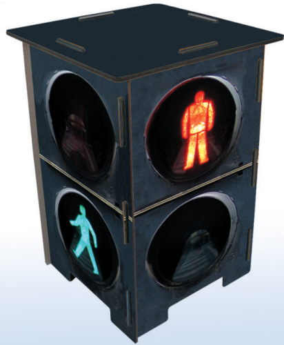
Fotohocker 'Ampel', 295 x 295 x 420 mm