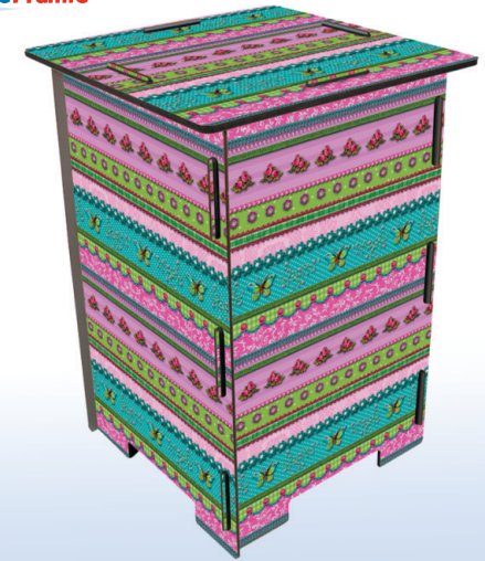
Fotohocker 'Eva Maria Nitsche', 295 x 295 x 420 mm