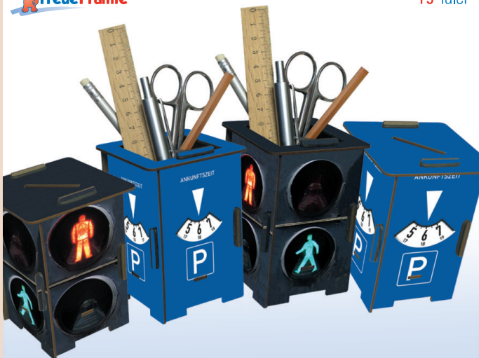
Twinbox (Spardose + Stiftebox) 'Parkuhr' / 'Ampel', 85 x 85 x 110 mm