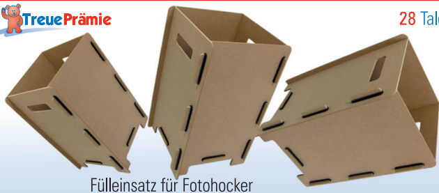
Fülleinsatz für Fotohocker