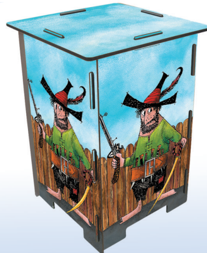
Fotohocker 'Räuber Hotzenplotz', 295 x 295 x 420 mm